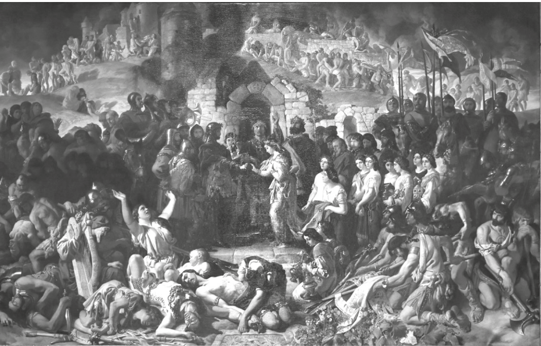
Il. 2. Daniel Maclise, Małżeństwo księżniczki Aoife z Leinster z Ryszardem de Clare, earlem Pembroke (1854).